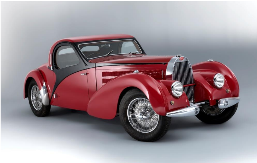
1938, Bugatti Type 57 C Coupé Atalante, Artcurial 2 février 2018, 2,5 M€ Record du monde pour ce type de véhicule vendu aux enchères

La répartition des enchères millionnaires 2 par type de marque est assez équilibrée, Bugatti et Mercedes en cumulent chacune trois.